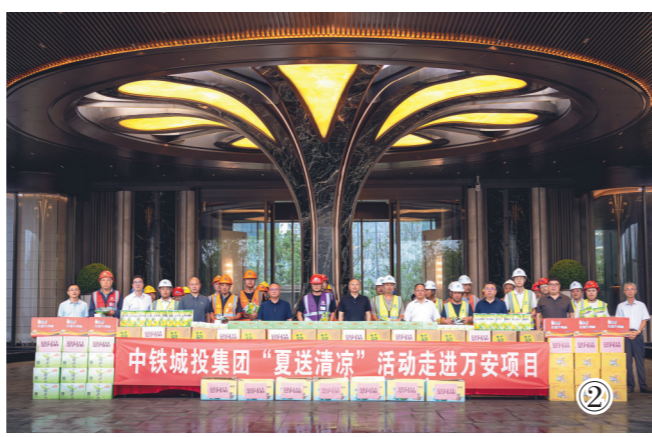
中铁城投集团“夏送清凉”活动走进万安项目