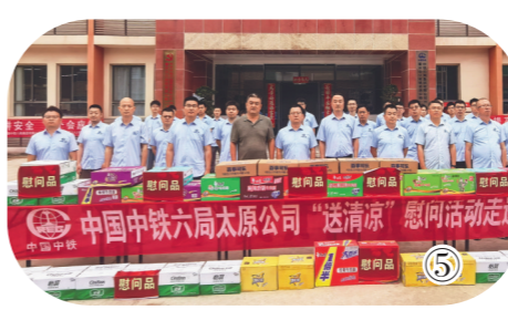
中国中铁六局太原公司“送清凉”慰问活动走进