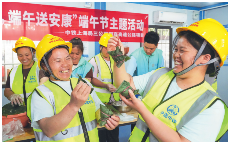
6月16日,中铁上海局三公司S30铜商高速公路项目部开展“情系农民工,端午送安康”主题活动。青年员工与一线产业工人携手包粽子、话家常,并将热气腾腾的粽子送到值守工友手中。