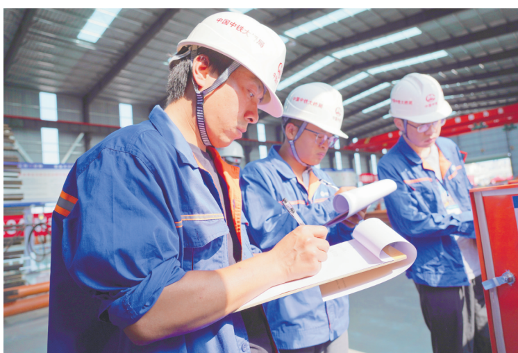
近日,中铁大桥局四公司在杭州湾跨海大桥3标项目部举办第二届群安员工作推进会暨技能大赛。在技能比赛环节,23名群安员分成4组,进入两处“现场隐患排查考核点”,要在25分钟内排查出事先设置好的45个安全隐患点。图为参赛群安员在现场排查安全隐患。

强化专业素质培训。狠抓员工队伍建设,构建多层次、多环节、多主体参与的业务培训格局。截至目前,各业务部门先后组织了项目管理、人员系统操作、货值系统操作培训、党支部党务知识培训等业务培训11场次,开展管理规章制度宣贯培训5场次,实现了各类培训全员覆盖、全员参与、全员推动。强化自学成才引导。广泛组织“创建学习型支部,争做知识型员工”活动,营造全员成长成才的学习氛围。鼓励员工充分利用党员活动室、网络平台、职工书屋等,参与与岗位工作专业相符的学历提升教育、职业资格培训。此外,积极通过“师徒带”帮学、“传帮带”互学等方式,让员工得到培训和锻炼。强化互查促学练兵。组织开展工作业务相互监督检查活动,营造“比、学、赶、超”的良好氛围。针对各业务条线,引领员工立足岗位,学习新知识、掌握新技能、钻研新业务、攻克新难题,加强各业务知识的相互学习,争做复合型人才。组织全员参与部门业务培训,相互开展督促检查,以比促学、以学促训,以查促练,增强全员学技术、钻业务、练本领的积极性和主动性。(陈洪昌)