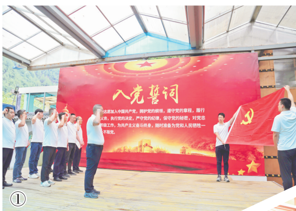
①8月25日至26日,中铁电气化局西安电化公司组织80余名党员开展研学实践活动,通过参观宝成线秦岭站区及宝成精神陈列馆等,进行了一场“寻根”之旅。图为重温入党誓词。